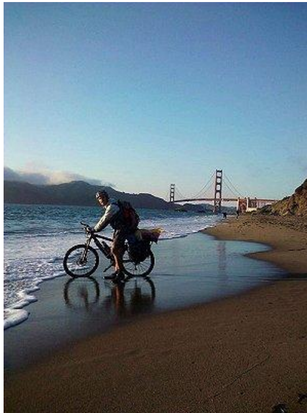
Das schönste Erlebnis war für den 23-Jährigen das Ankommen in San Francisco.

Zeitungsartikel von Leonie Hemminger aus "Stuttgarter Nachrichten", vom 24. September 2010 www.stuttgarter-nachrichten.de