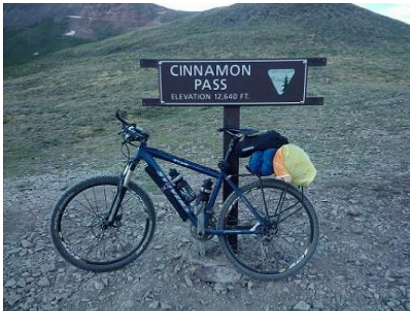
Endlose Straßen und hohe Pässe waren Teil der Reise.

Spätestens als Grabenhof in San Francisco einfuhr und über die Golden Gate Bridge radelte, hatte er auch die letzten Skeptiker auf seiner Seite. Auch er selbst war überwältigt: „Es war ein Megagefühl, nach drei Monaten das Ziel erreicht zu haben.“ Bei der Abfahrt in New Jersey hatte er den Hinterrreifen in den Atlantik getunkt, nun folgte der Vorderreifen in das kühle Nass des Pazifiks. Dass er noch einmal in die Vereinigten Staaten zurückkehren wird, steht für Grabenhof fest. „Dann werde ich aber eine klassische Rentner-Touri-Tour machen.“