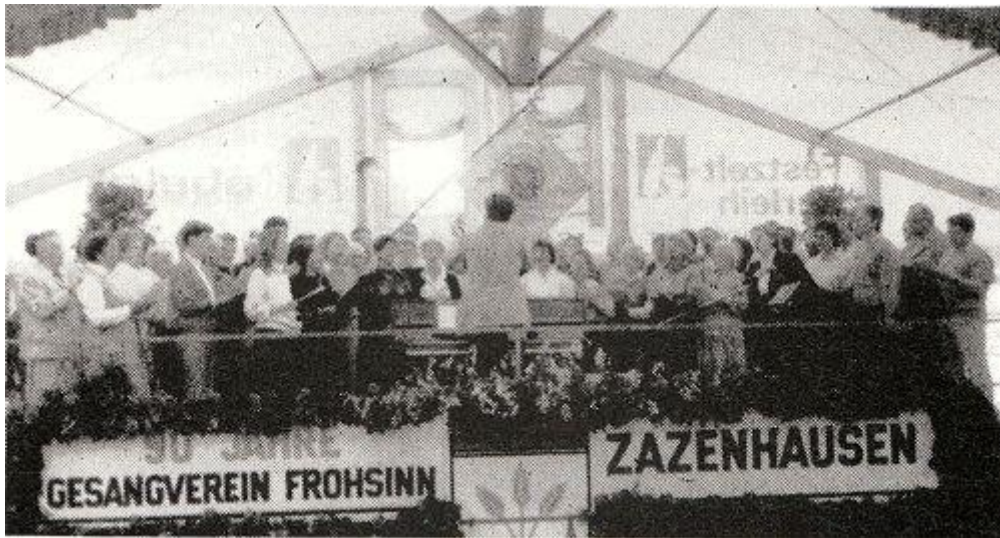
STÄNDCHEN: Der Gesangsverein Frohsinn aus Zazenhausen feierte 90. Geburtstag.

Wie bereits beim Sommerfest 1985 fand am Sonntag morgen im Festzelt ein ökumenischer Gottesdienst mit Pfarrer Trosse und Pfarrer Belz von der katholischen Dreifaltigkeitskirche in Rot statt, mitgestaltet von den Sängern und Sängerinnen. Das anschließende schon traditionelle Gästesingen war wieder ein voller Erfolg.