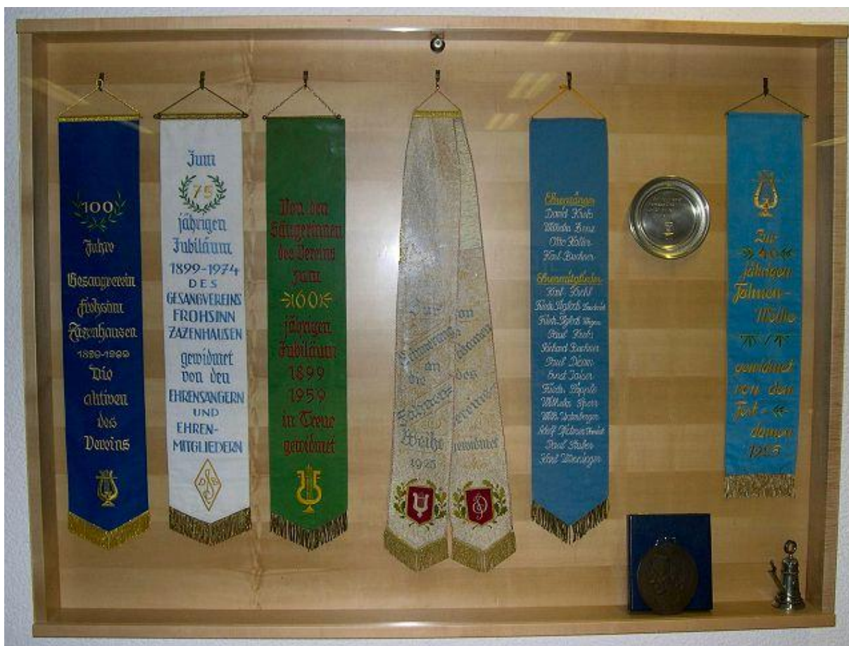
Ehrenwimpel des Gesangvereins Zazenhausen e.V.

Vorgetragen wurde das Gedicht seinerzeit von Fräulein Sigloch »als Einleitung des Weiheaktes«.