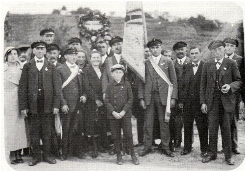
Sängerfest 1930 in Hofen

Auch in den 30er-Jahren wurden - wie schon zuvor - seitens des Vereins fleißig die entsprechenden Veranstaltungen des Schwäbischen Sängerbundes, die Gausängerfeste und natürlich die Feste und Konzerte, sowie sonstige Veranstaltungen der umliegenden Vereine besucht und auch gesanglich bereichert. Die Sängerinnen und Sänger nahmen weiterhin an verschiedenen Sängerwettbewerben teil und erreichten beachtliche Erfolge.