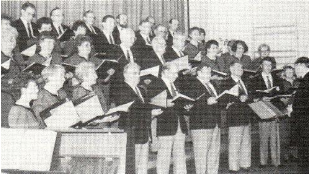
Die „Liedertafel Kelowna“ aus Kanada war am Samstagabend zu Gast beim Zazenhäuser Gesangverein Frohsinn und begeisterte das Publikum.