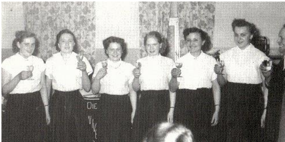
Für fleißigen Singstundenbesuch erhält jede Sängerin und Sänger ein Römerglas, gefüllt mit Wein