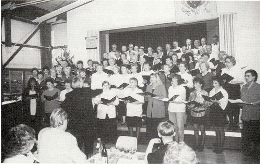
Der ZUFF war beim Besuch der »Liedertafel Kelowna« beim Gesangverein Frohsinn in Zazenhausen und berichtet in seiner Kolumne darüber.